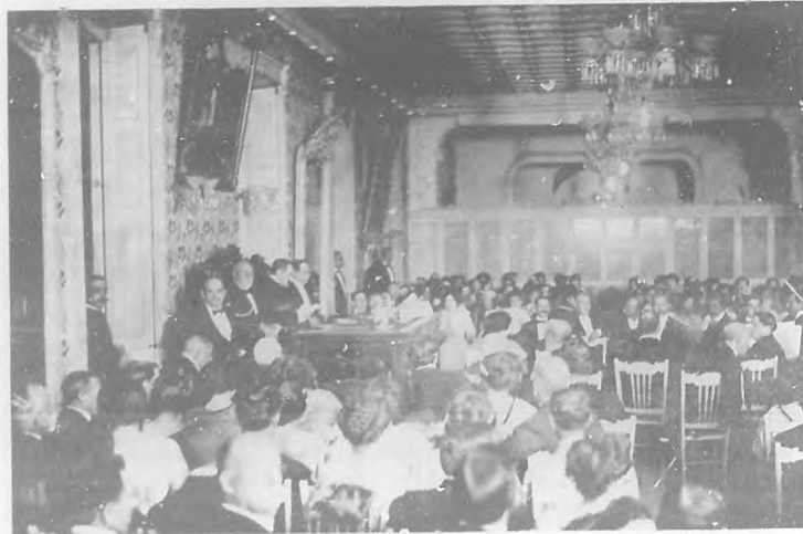
De la Academia Nacional de Artes y Letras.—Aspecto de la presidencia y concurrentes al solemne acto de la inauguración de los trabajos académicos del año 1912 á 1913 y distribución de los premios del Concurso celebrado recientemente.

"Cuba Pedagógica".—La pasada semana celebró su noveno aniversario de publicación, la culta revista de