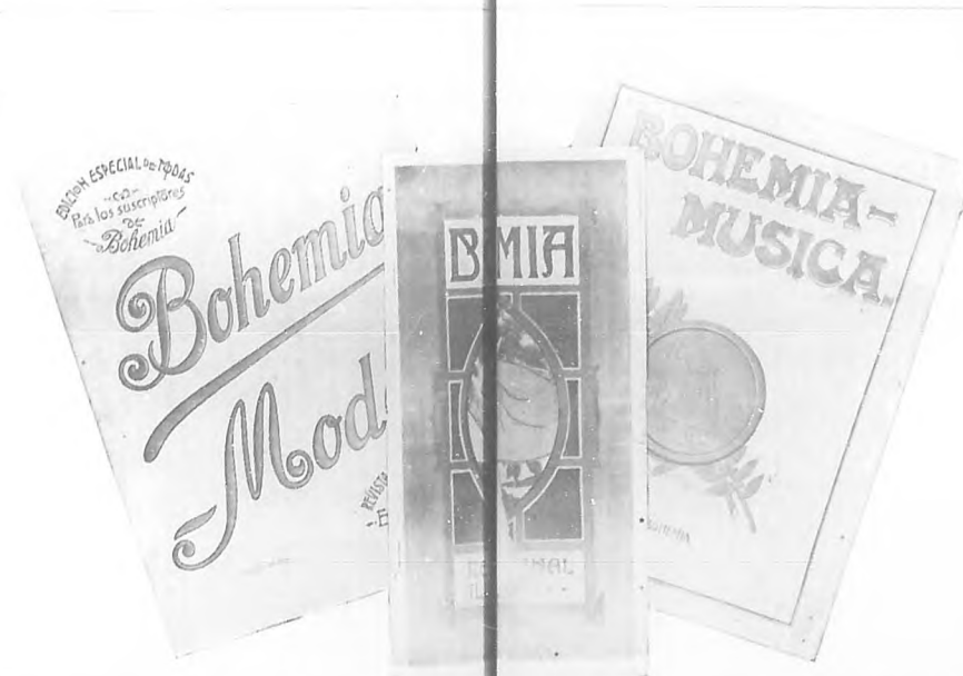
Facsímiles de las carátulas de BOHEMIA, BOHEMIA MODES y BOHEMIA MUSICA. Las suscripciones a estas publicaciones de verdadera utilidad por condensarse en ellas la literatura é información, las modas y las artes, y todo lo que además interesa al lector, serán recibidas por la cuota de diez pesos plata.

Quien se suscriba por un año, á partir del mes de Enero próximo, pago adelantado, en vez de abonar doce pesos, como antes, abonaría, abonará solamente diez pesos plata, y tendrá opción á todas las ventajas que hemos enumerado.