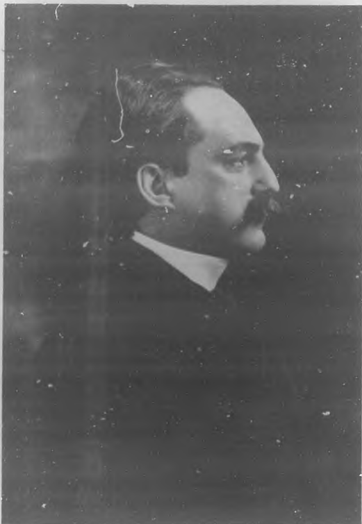
GONZALO DE QUESADA

También hemos dicho que ha venido a tiempo el gran patriota. Y así es, con efecto. Porque ahora podrán sus admiradores, incluyendo a los que no son sus devotos, que también lo admiran, hacer comparaciones. Ha venido cuando han muerto todos los dioses, cuando los cubanos ya hemos derribado todos los ídolos... Y por cierto que los hemos derribado sin maldita la ayuda de diablos extraños, dicho sea en nuestro honor, no habiendo en ello, a nuestro juicio, desdoro alguno para los tales, puesto que Cuba bella viene a ser en estos momentos una sucursal del infierno. Hay, pues, infinitos altares vacantes. ¡Hasta Aspíazo ha visto y palpado que el suyo de nada le ha valido! Dícese que este dios, amén de contar con la ayuda de diablos auténticos, (y no aludimos personalmente a nadie), contaba con la ayuda de las tres enanas partes del pueblo habanero, el cual, según Pero Grullo, no es